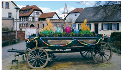
Am Roten Kreuz