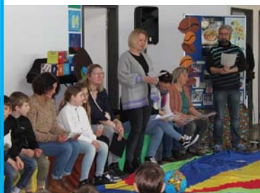
Das Team bei der Vorstellung